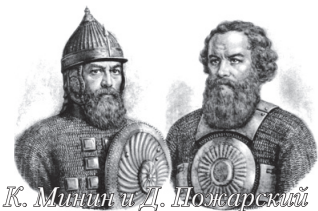
К. Минин и Д. Ножарский

ВСТАВАЙ, СТРАНА ОГРОМНАЯ, ВСТАВАЙ НА СМЕРТНЫЙ БОЙ. С ФАШИСТСКОЙ СИЛОЙ ТЕМНОЮ, С ПРОКЛЯТОЮ ОРДОЙ! В. ЛЕБЕДЕВ КУМАЧ И А. АЛЕКСАНДРОВ