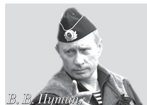
В. В. Путин.

«Мы будем действовать последовательно, осмысленно и решительно. Устраняя фундаментальные причины коррупции и карая конкретных коррупционеров. Создавая мотивацию для тех людей, которые готовы служить России верой и правдой. Таких людей у нас в стране традиционно много. Они будут востребованы.»