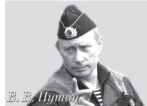
В. В. Путин.

«Мы будем действовать последовательно, осмысленно и решительно. Устраняя фундаментальные причины коррупции и карая конкретных коррупционеров. Создавая мотивацию для тех людей, которые готовы служить России верой и правдой. Таких людей у нас в стране традиционно много. Они будут востребованы.»