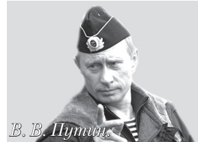
В. В. Путин.

«Мы будем действовать последовательно, осмысленно и решительно. Устраняя фундаментальные причины коррупции и карая конкретных коррупционеров. Создавая мотивацию для тех людей, которые готовы служить России верой и правдой. Таких людей у нас в стране традиционно много. Они будут востребованы.»