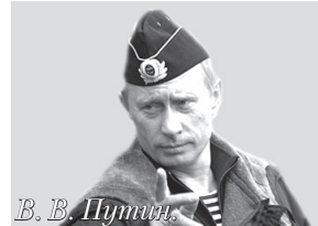
В. В. Путин.

«Мы будем действовать последовательно, осмысленно и решительно. Устраняя фундаментальные причины коррупции и карая конкретных коррупционеров. Создавая мотивацию для тех людей, которые готовы служить России верой и правдой. Таких людей у нас в стране традиционно много. Они будут востребованы.»