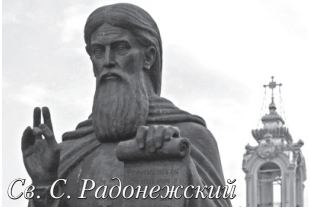
Св. С. Радонежский