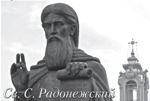
Св. С. Радонежский