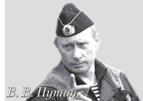
В. В. Путин.

«Мы будем действовать последовательно, осмысленно и решительно. Устраняя фундаментальные причины коррупции и карая конкретных коррупционеров. Создавая мотивацию для тех людей, которые готовы служить России верой и правдой. Таких людей у нас в стране традиционно много. Они будут востребованы.»